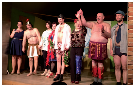
Ochotníci ZDIBY hra Na správné adrese od Marca Camolettioho