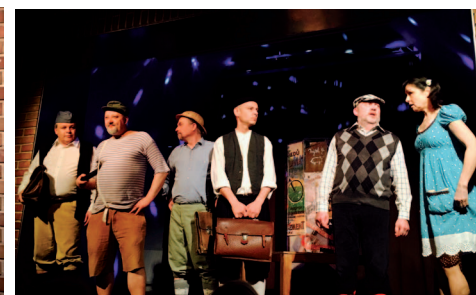
Divadýlko na dlani Mladá Boleslav Bylo nás pět od Karla Poláčka