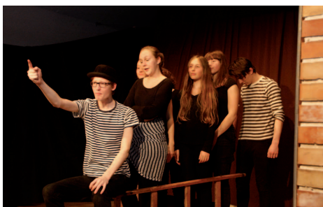
Ochotníci z Klubu uměleckých katastrof (KUK) vystoupili s hrou „Může za to štrůdl!“